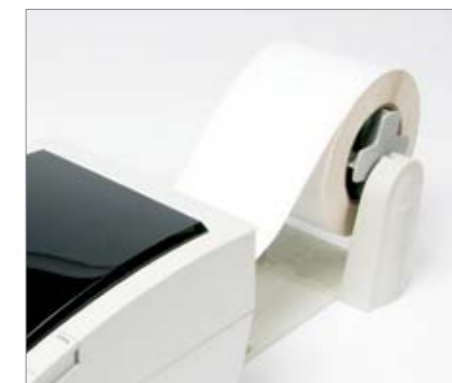
Le support rouleau externe est l'une des nombreuses options

Si polyvalente qu'elle sait même imprimer des médias spécialisés