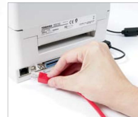
Interface LAN 10/100 Mbps intégrée en standard