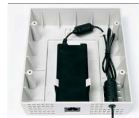
Un cache d'alimentation optionnel pour les installations en magasins